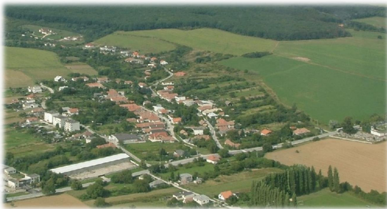
Letecký pohľad na obec Vozokany